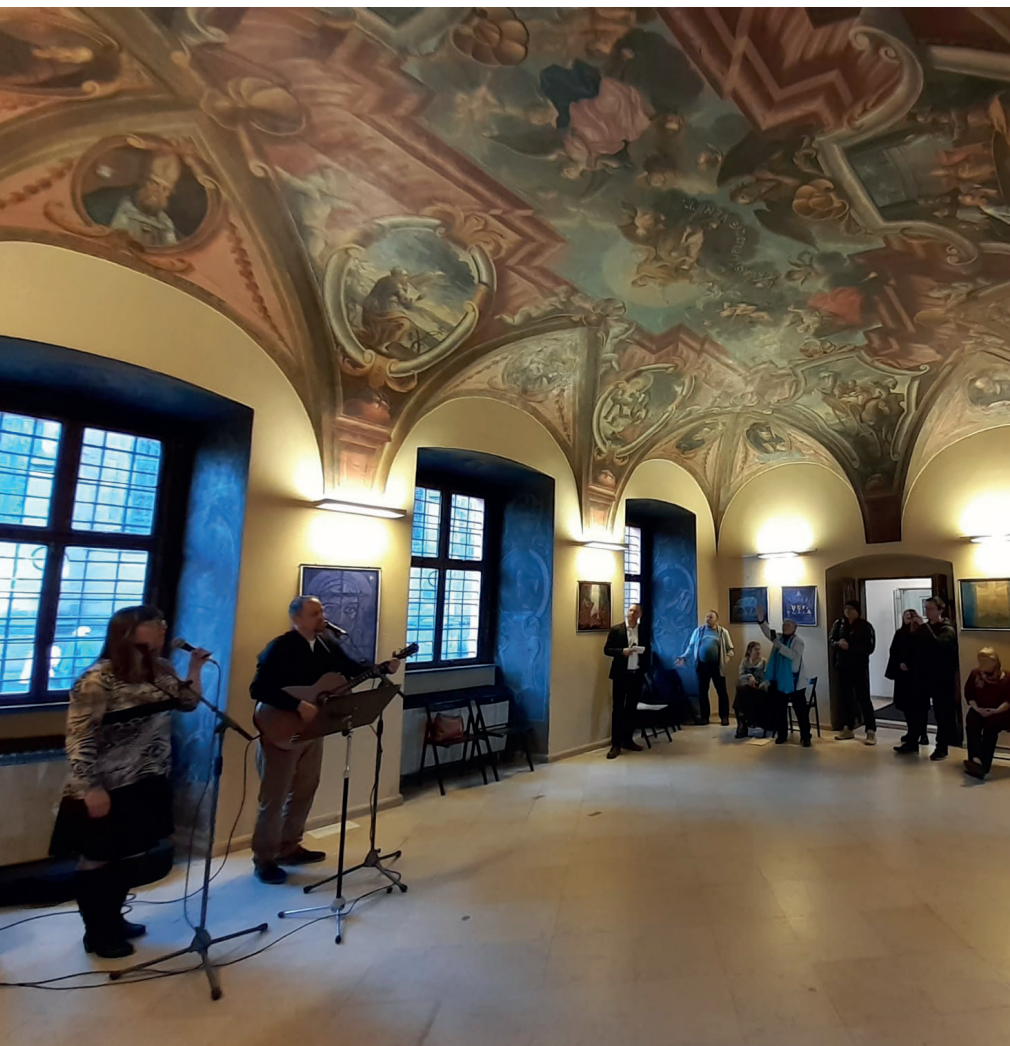
Na Pražském hradě začala výstava reprodukcí obrazů Václava Lamra. (více na str. 6)